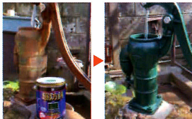
サビキラーカラー(グリーン)を直接塗布