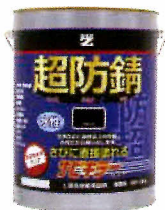
サビキラーカラー-4Kg