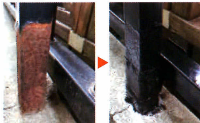
①下塗り(サビキラーPRO)→②補修(バンジエイド) →③上塗り(サビキラーカラー)