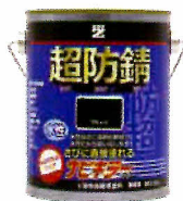
サビキラーカラー-1Kg