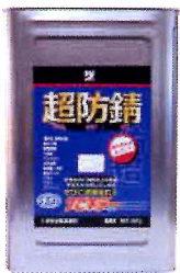
サビキラーカラー-16Kg