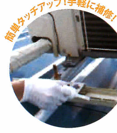
エアコン室外機標準色でタッチアップ補修 ※サビがひどい場合は事前にサビキラープロを塗布することでより防錆効果は高くなります。