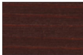
▲SG-RBR (ラスティックブラウン)