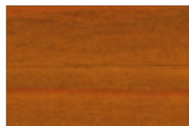
▲SG-NAT (ナチュラルチーク)