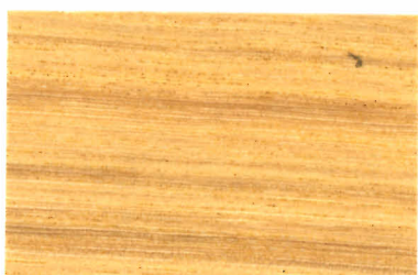
0001 オフカラー (単独使用不可)